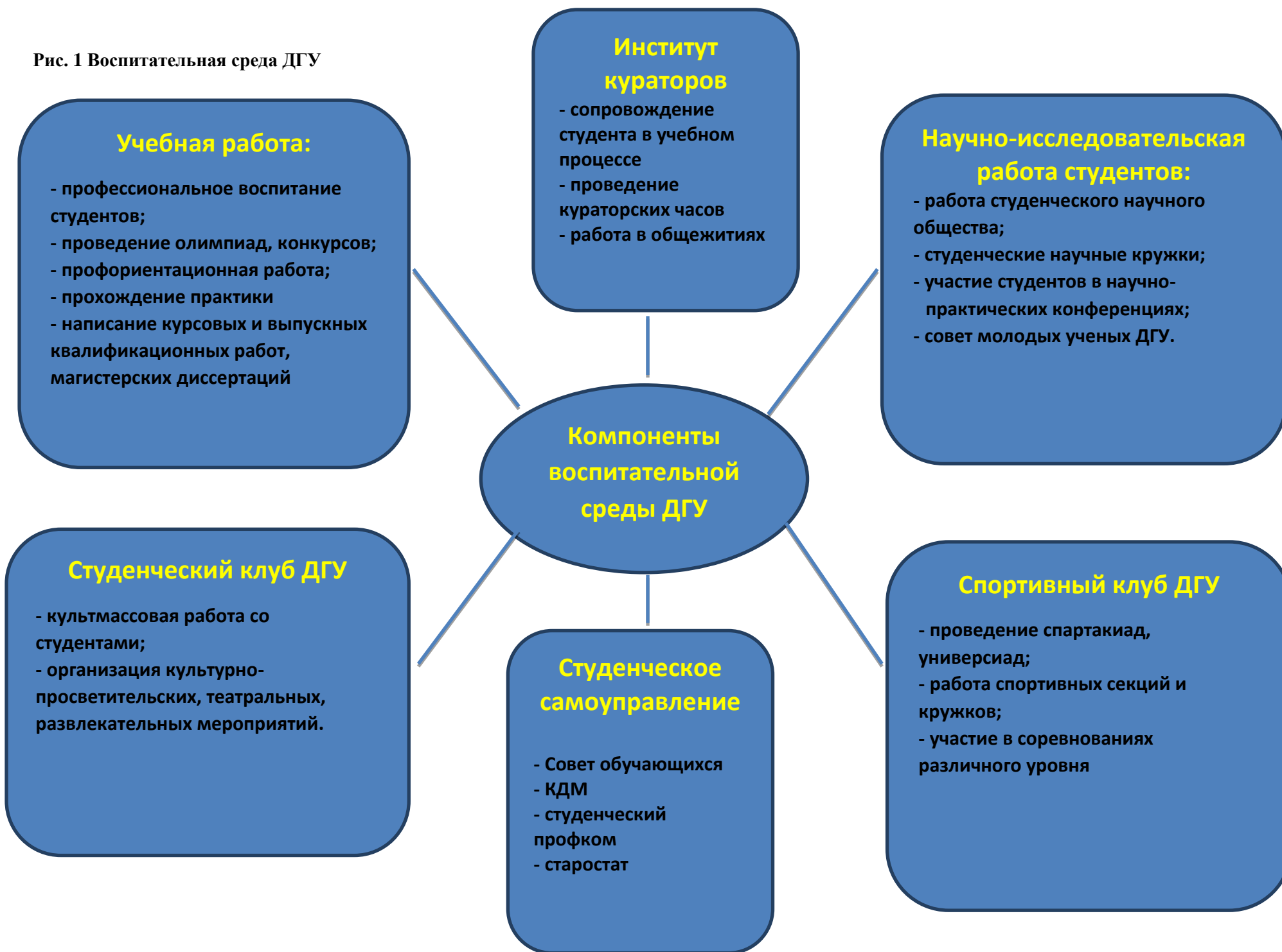
Рис. 1 Воспитательная среда ДГУ